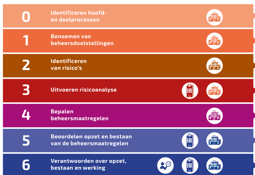
Figuur 1: processtappen control framework

In stap 4 van het Control Framework (Bepalen beheersmaatregelen) bepaalt de zorgaanbieder welke maatregelen hij/zij treft om de geïdentificeerde risico's in het proces te beheersen.